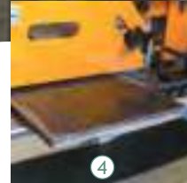
4 Lama kesme istasyonu Flat Bar cutting Station Резка листа