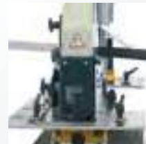
Açılı köşebent kesme Angle section (45°) cutting Резка уголка под углом

HKM может пробивать диаметр до 38мм (* Диаметр пробивки, толщина материала могут быть изменены в зависимости от модели (смотри таблицу)