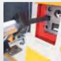
Elektrikli arka dayama (Çift pistonlu standart) Electrical back gauge (Standard in double pistons)