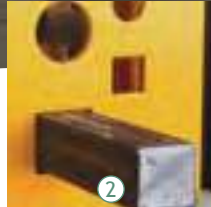
2 Kare dolu profil kesme istasyonu Square solid bar cutting station Резка квадратного прутка