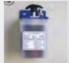
Merkezi yağlama pompası Central Lubrication Pump Насос для смазки