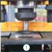
1 Zımbalama istasyonu Punching station Пробивка отверстий

The machine comes with a rectangular notching tool which you can use for your notching works. We provide special notching tools for your notching works.