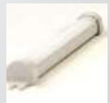
Led aydınlatma Led lighting светодиодная подсветка

Электронный задний упор для настройки размера резки (стандартно для 2-х поршневых)