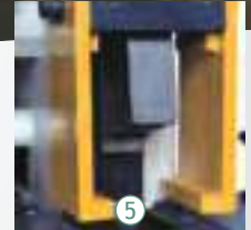
5 U çentik açma istasyonu U-notching station Высечка