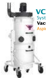
VCE 1570 Système d'aspiration de copeaux par Vacuum Chip Extractor Aspiradora de limaduras VCE