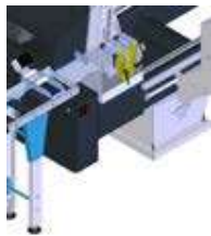
Système de coupe de profil court Short cut system Sistema de corte de perfiles cortos