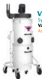
VCE 1570 Système d'aspiration de copeaux par Vacuum Chip Extractor Aspiradora de limaduras VCE